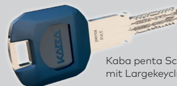
Kaba penta Schlüssel mit Largekeyclip