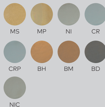
Zylinderoberflächen (nicht farbverbindlich)

Weitergehende Details und Bestellungen finden Sie im aktuellen Kaba Katalog.