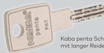
Kaba penta Schlüssel mit langer Reide